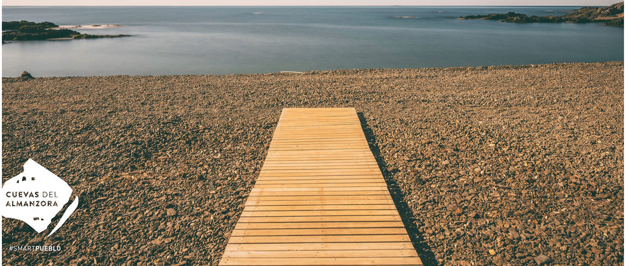
Playa de La Dolores en Villaricos.