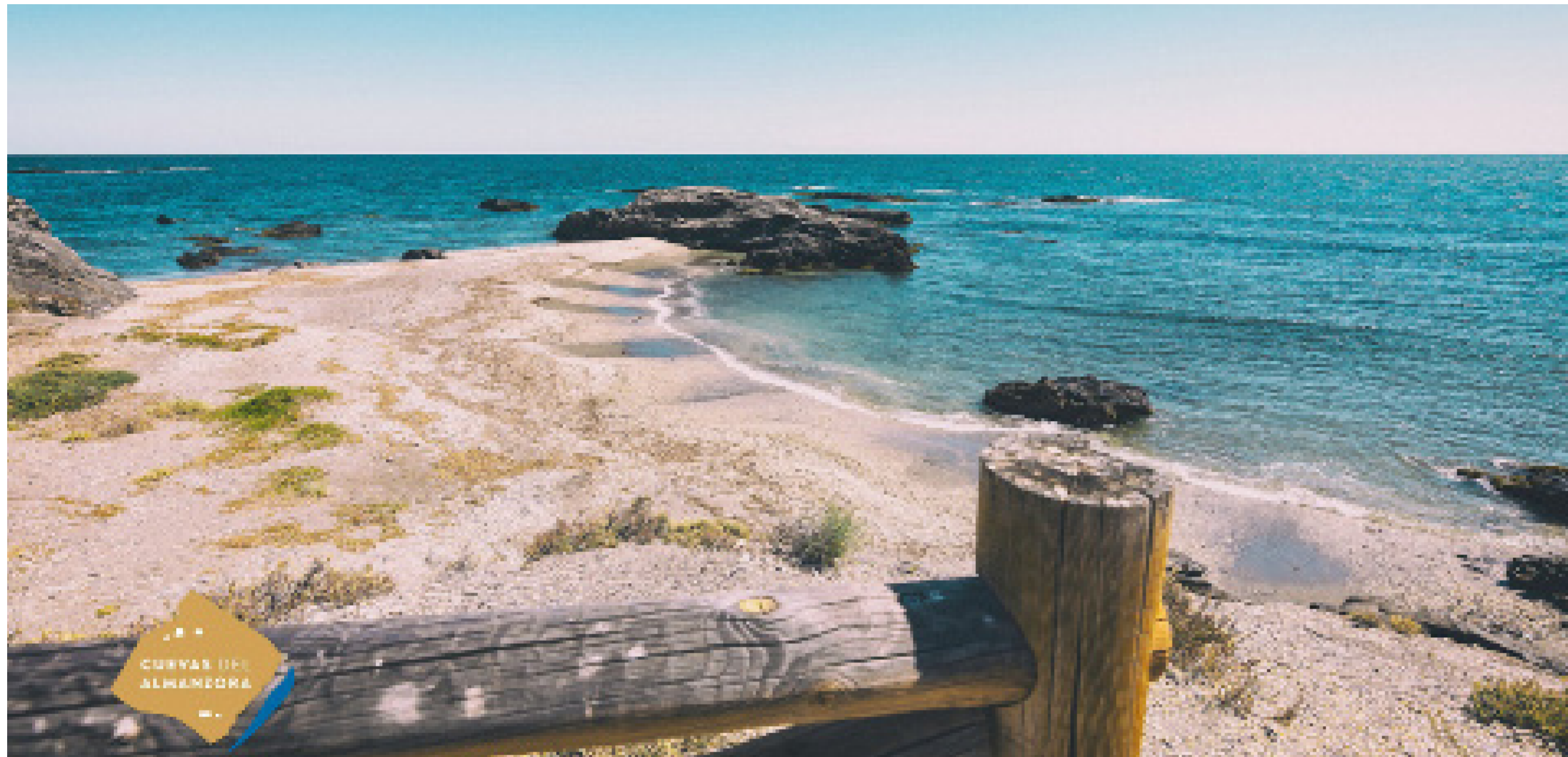
Cala Cristal, una de las maravillas de la costa cuevana, que también ha contado con mejoras en sus accesos así como pasarelas y vallas de madera.