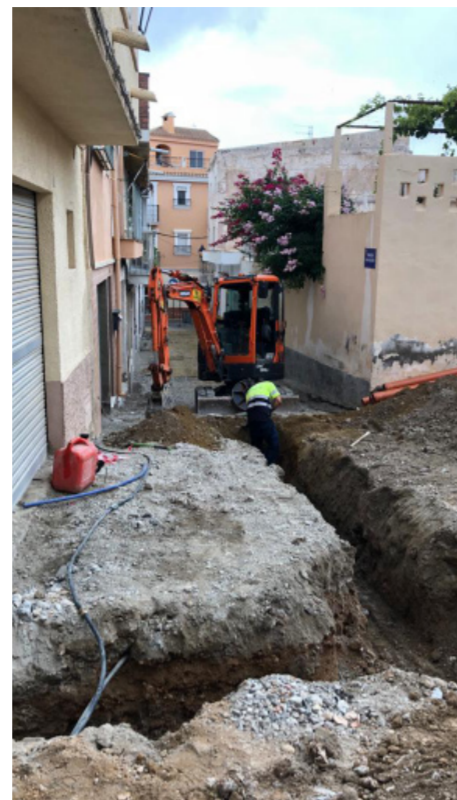
Actuación en la calle San Agustín.

proveniente del Plan de Fomento de Empleo Agrario, consisten en la mejora de los acerados, pavimentación y la renovación del alumbrado público mediante farolas equipadas con tecnología led y respetuosas con la contaminación del cielo nocturno.