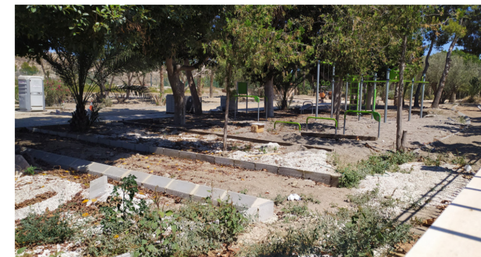
Avance de las obras en el Parque Luis Siret.