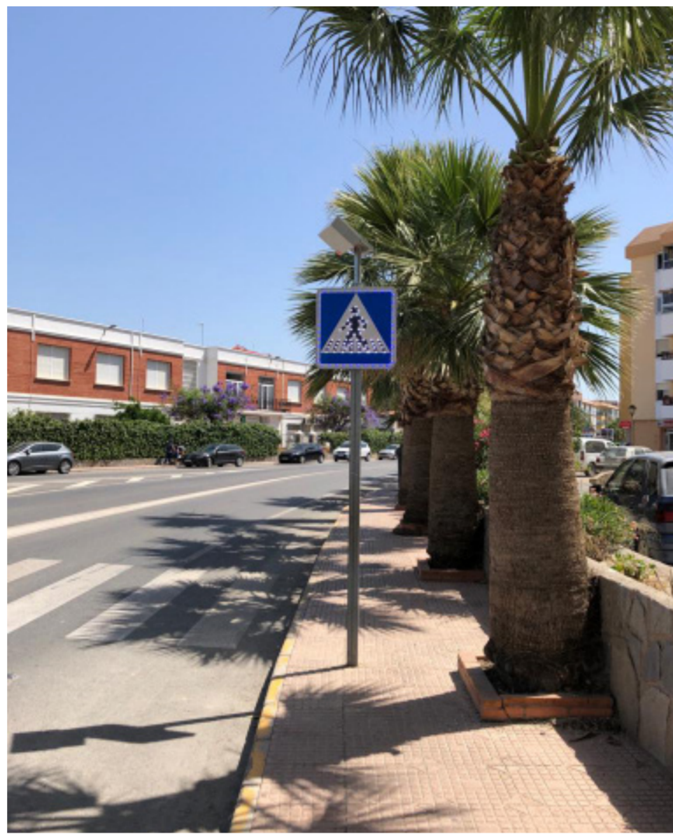
Señal luminosa en el paso de peatones frente al IES Jaroso.

De esta forma, continúan en el municipio las actuaciones cuyo objetivo no es otro que el hacer más segura y cómoda la vida de los cuevan@s.