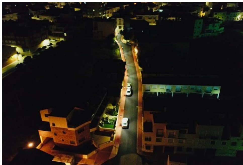
Calle San Sebastián tras las obras de mejora.